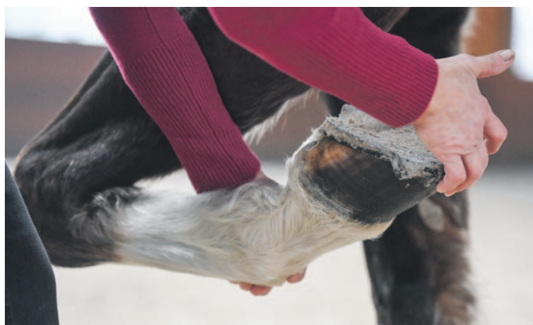
Mobilisation des Fesselgelenkes.

Die Trägerschaft der Prüfung, der Schweizerische Verband für Tierphysiotherapie SVTPT führt die fachlich anspruchsvolle Prüfung alle zwei Jahre unter der Aufsicht des SBFJ durch. Dieses stellt abschliessend den erfolgreichen